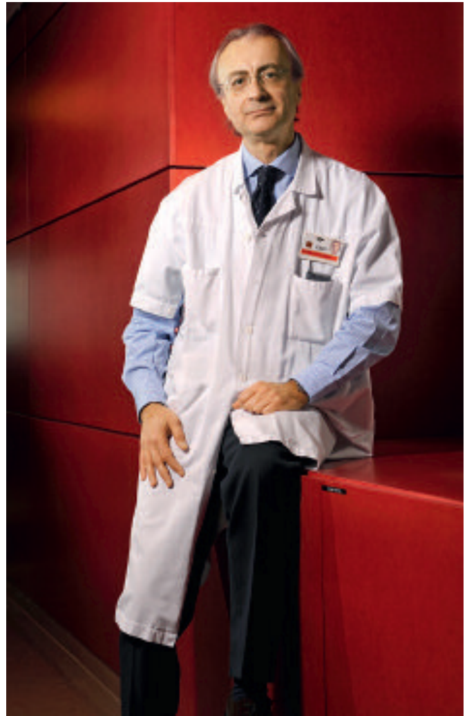
Expert sur le sida de renommée mondiale, Giuseppe Pantaleo, avec son équipe, développe à Lausanne de nouveaux vaccins contre le VIH, analyse leur efficacité et coordonne la plus grande étude clinique européenne.

A ce jour, seules trois études de phase III ont été lancées autour du monde pour tester la capacité d'un vaccin à protéger d'une vraie infection du sida. Ces campagnes doivent impliquer des personnes à risque, comme des prostituées ou des utilisateurs de drogues intraveineuses. Les chercheurs profitent toujours des séances d'information pour faire de la prévention (utilisation de préservatifs, etc.) – même s'ils sont bien obligés de compter sur le fait qu'un certain nombre de participants ne les suivront pas, et qu'ils s'infecteront... «L'échec de STEP rendra plus difficile la réalisation de telles études, indique Séverine Burnet. Certains représentants des communautés homosexuelles aux Etats-Unis se sont montrés très critiques par rapport à des nouveaux projets de tests basés sur la même stratégie que STEP.» En 2004, une étude avait été lancée auprès de 16'000 personnes en Thaïlande, malgré les sérieuses